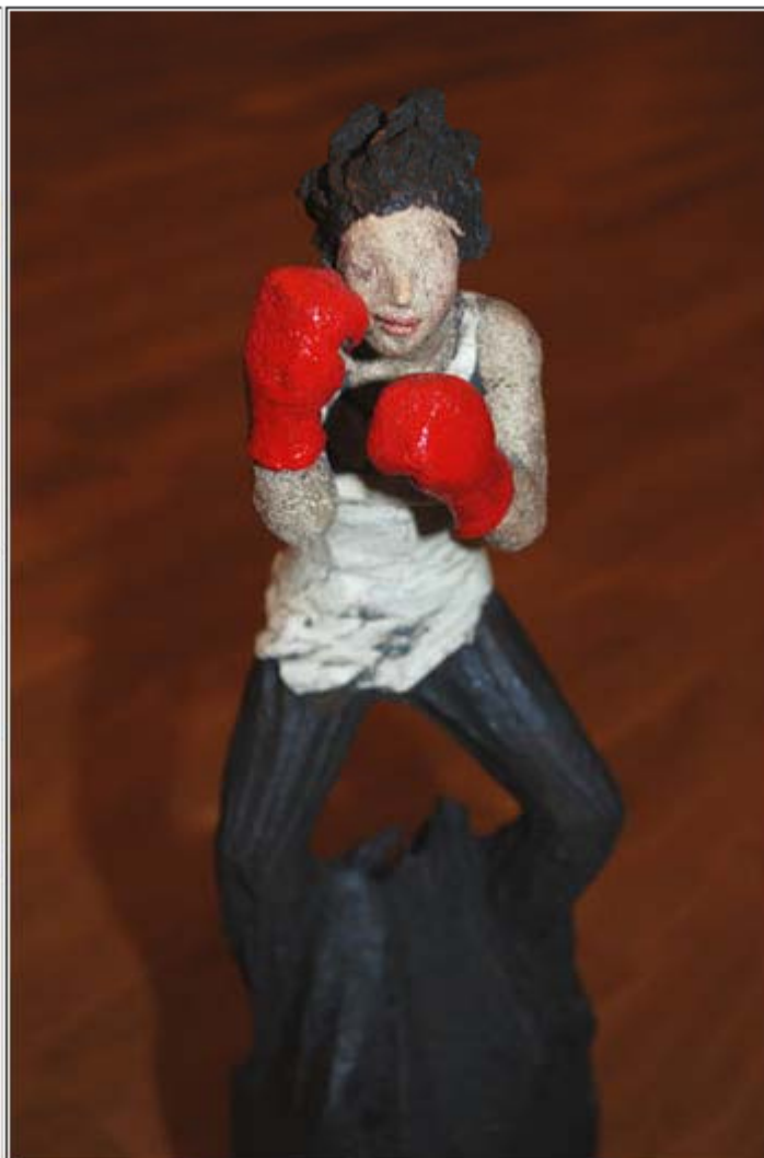
Slik ser statuetten ut på nært hold.