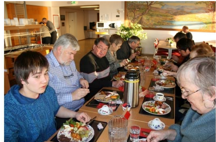
Helse Finnmarks Brukerutvalg for pasienter og pårørende